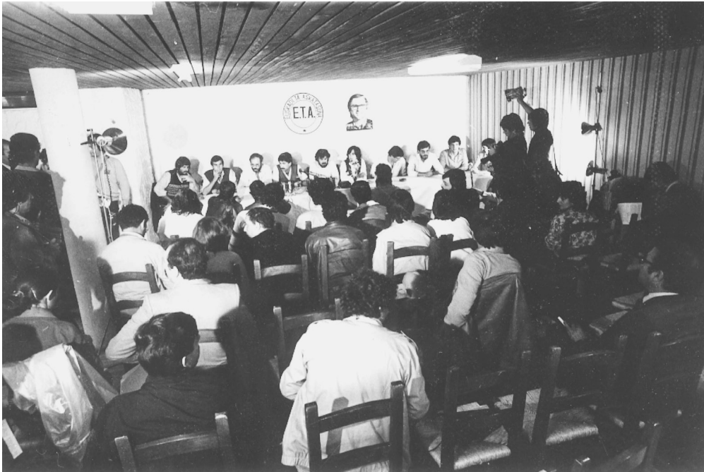
Imagen 7. Última rueda de prensa de ETAp VII Asamblea, 30 de septiembre de 1982