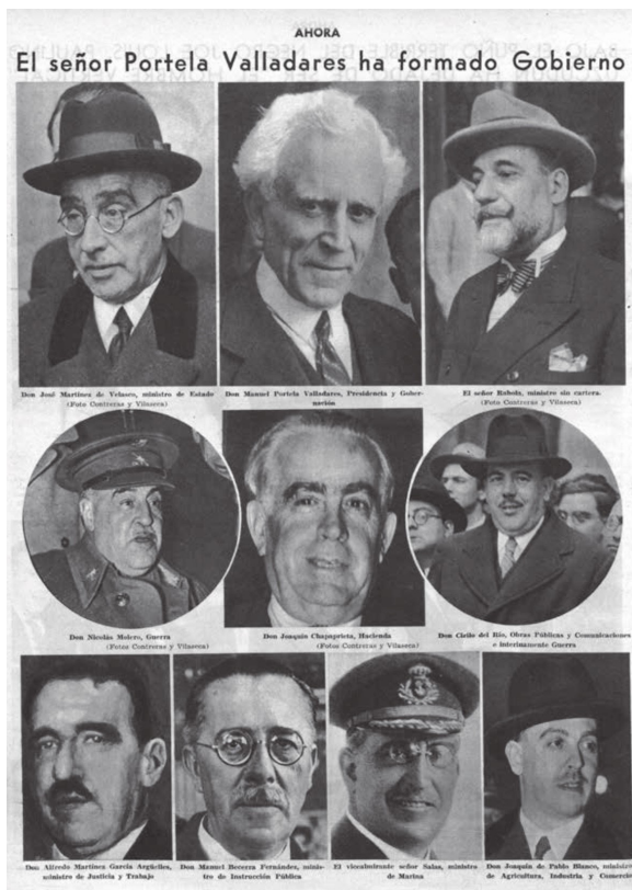
Primer Gobierno de Manuel Portela Valladares