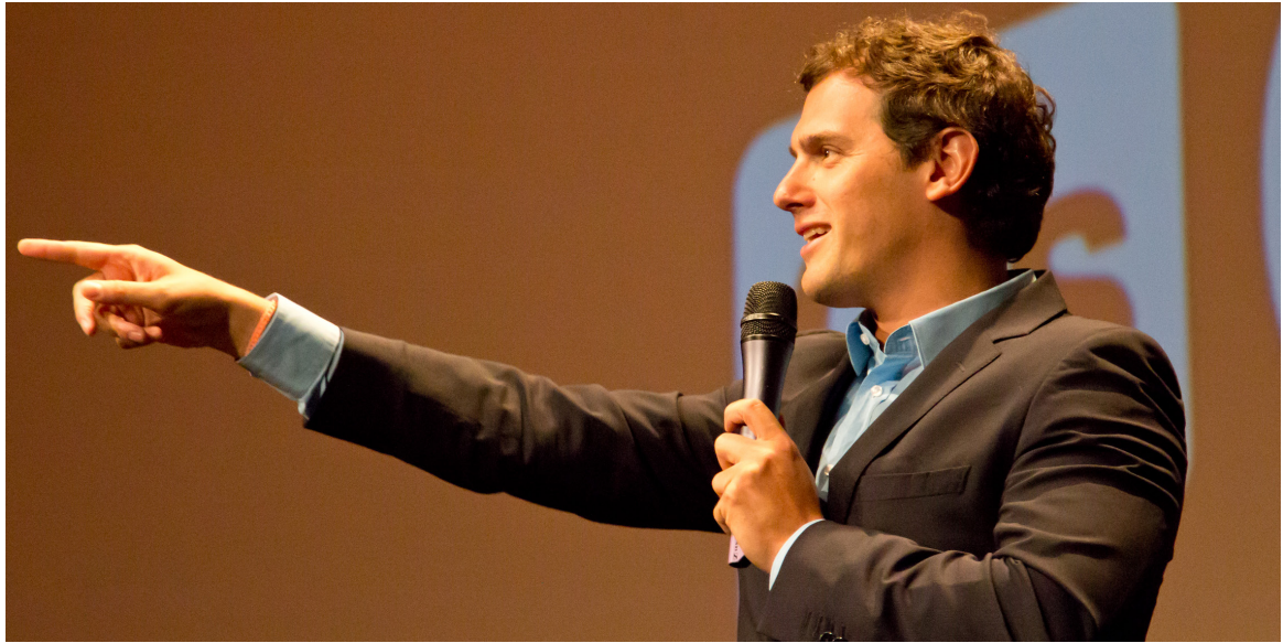
Albert Rivera en un mitin de Ciudadanos (2015)