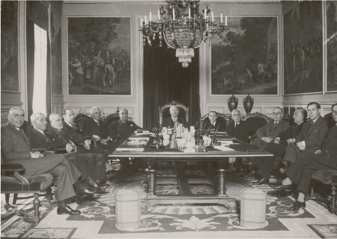
Gobierno de Alejandro Lerroux de 6 de mayo de 1935 a 25 de septiembre de 1935

los casos donde Lerroux aprovechó las nuevas incorporaciones para oxigenar agrupaciones locales aquejadas de tejemanejes y compadres. 24