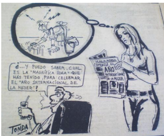
Fig.12, La Voz de Almería , 28.2.1975