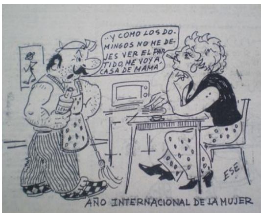
Fig.10, La Voz de Almería , 12.4.1975

Ya hemos visto en apartados anteriores algunas viñetas aparecidas a lo largo del Año Internacional de la mujer en el periódico La Voz de Almería . De las 30 viñetas que encontramos, unas 20 tratan directamente el Año Internacional de la Mujer o algún aspecto de las reivindicaciones feministas. Otras seis tienen por tema principal el destape y el resto son ejemplos particulares, que por únicos no se han clasificado. Agrupando el grueso de viñetas, dedicadas al año Internacional de la mujer hemos observado la existencia de un esquema simple y repetitivo que resume el punto de vista de los autores.