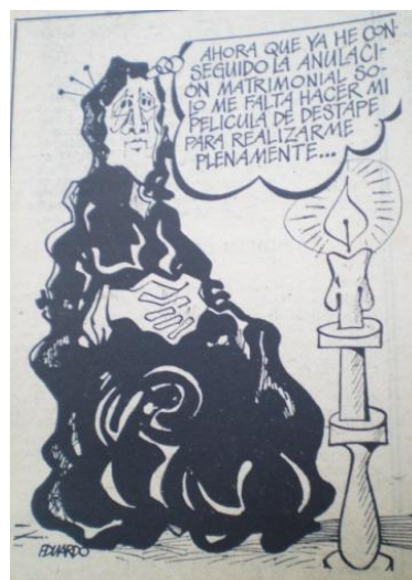
Fig. 9, La Voz de Almería, 28.11.1975