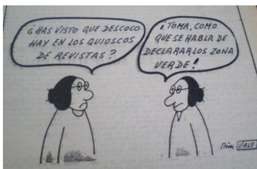
Fig.5, La Voz de Almería , 30.5.1975