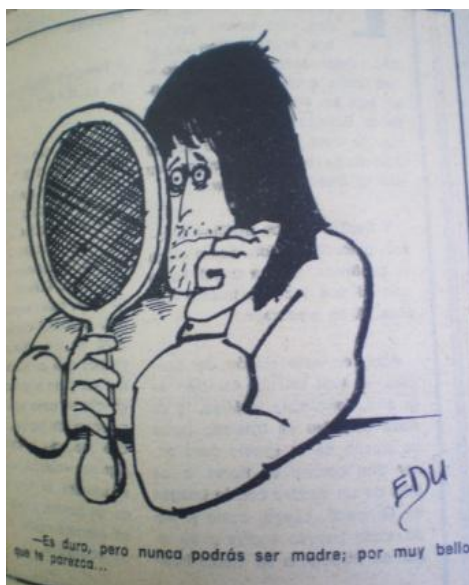
Fig.1, La Voz de Almería , 30.5.1975