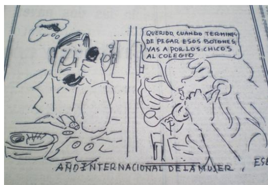
Fig.11, La Voz de Almería , 15.7.1975