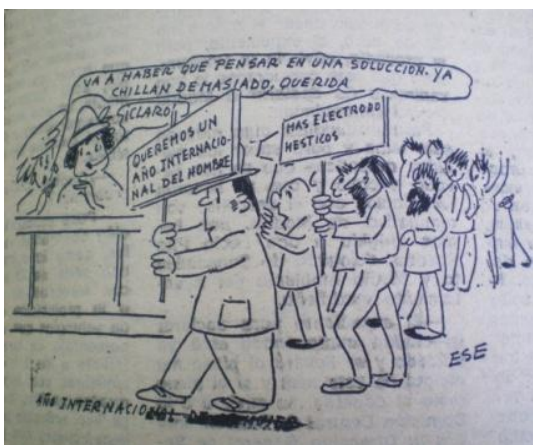
Fig.16, La Voz de Almería , 30.5.1975