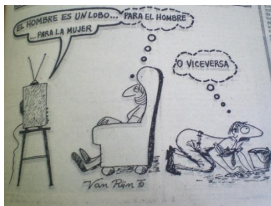
Fig.13, La Voz de Almería , 3.6.1975