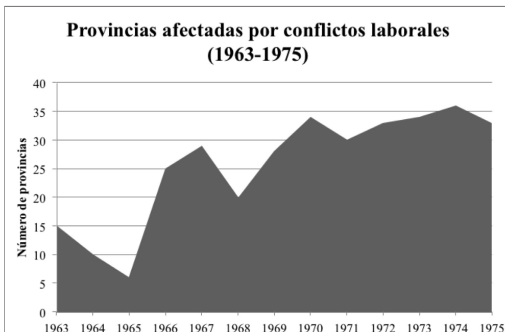
Gráfico 3: Elaboración propia a partir de los informes anuales sobre conflictos laborales del Ministerio de Trabajo (1963-1975), Archivo Central del Ministerio de Trabajo.